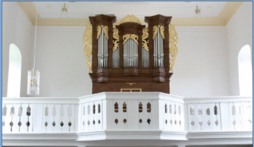
Die neue Orgel in Neuses am Raueneck

Als Glücksfall erwies sich der Umstand, dass durch die Vermittlung vom Bau- und Kunstreferat der Diözese Würzburg die Prospektfront der alten Orgel aus Dingolshausen verwendet werden konnte. Nach Restauration der Front und ergänzen des übrigen Gehäuses durch