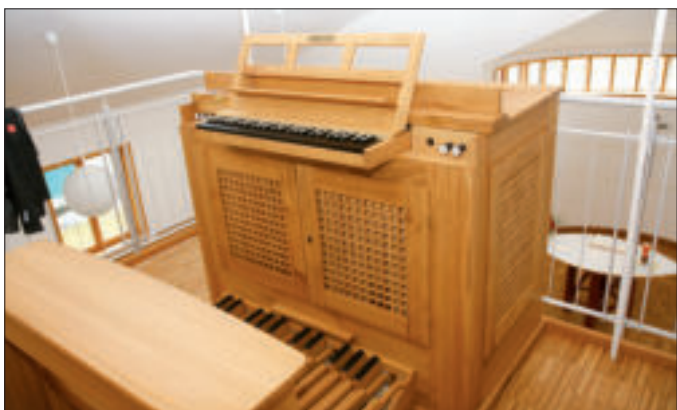
Die Truhensorge in Ampfing