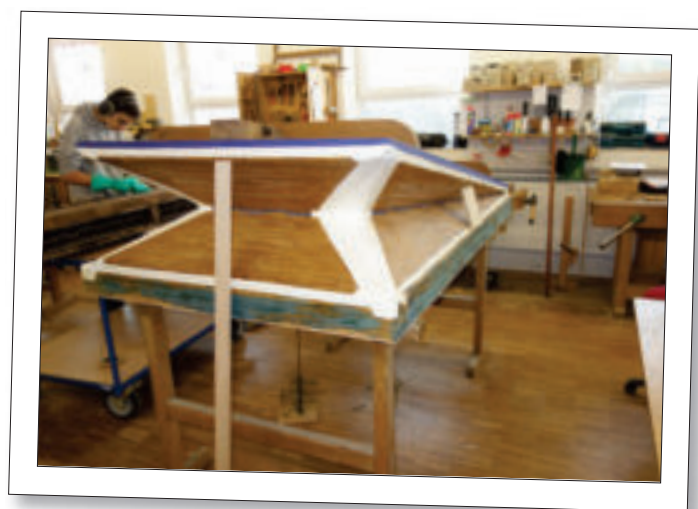
Schöpfbalg von Michelau während der Restaurierung