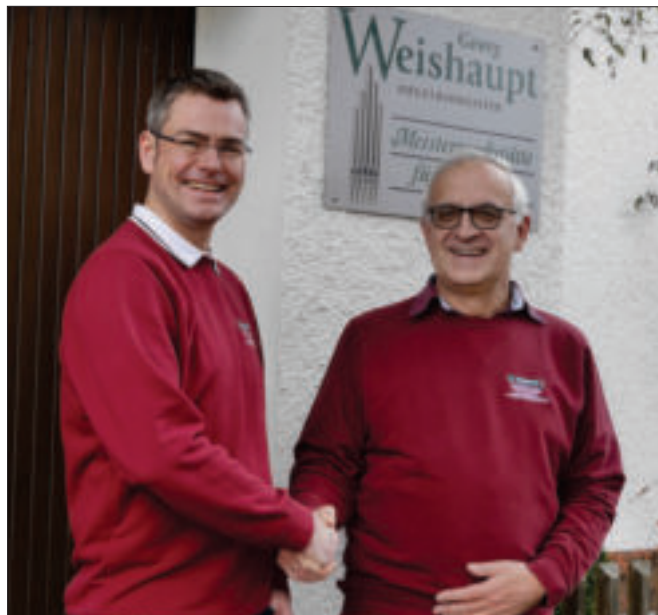
Die beiden Orgelbaumeister nach der Unterzeichnung des Übergabevertrages

Wir hoffen, dass Sie uns auch künftig Ihr Vertrauen schenken werden und versprechen gleichzeitig, auch in Zukunft eine solide handwerkliche Arbeit anzubie-