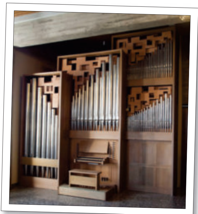
Die Rieger-Organ am ehemaligen Standort in Bern

Wir danken der Pfarrei St. Vinzenz Klettham für diesen Auftrag!