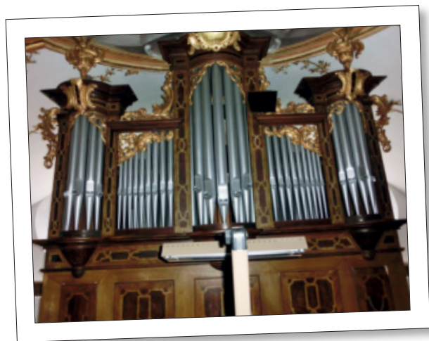
Die restaurierte Orgel der Wallfahrtskirche in Buggenhofen.

ihre Einzelteile zerlegt und das alte Gehäuse mit viel Handarbeit ergänzt. Windlade, Traktur und Pfeifenwerk wurden ebenfalls gründlich restauriert. Das angebaute Pedalregister wurde mit neuem Gehäuse in eine Wandnische versetzt und die Windanlage wurde neu angefertigt. Für die gute Zusammenarbeit möchten wir uns bei allen Beteiligten bedanken!