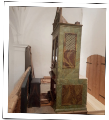
Orgel mit neuem Podest