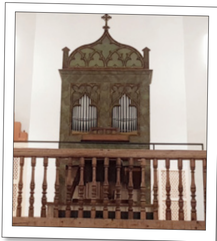
Klein aber fein