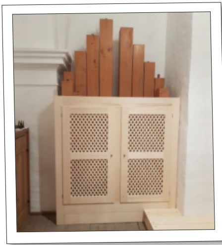
Das neue Pedalgehäuse