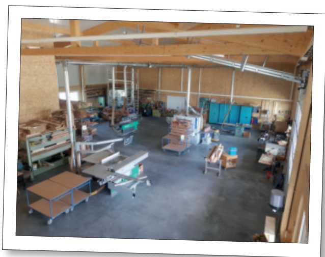
Blick in die neue Werkstatt kurz nach dem Einzug.